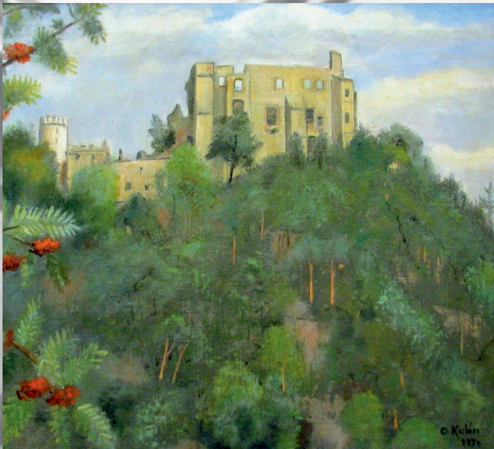
O. Kubín, Hrad Boskovice