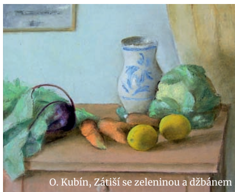
O. Kubín, Zátíší se zeleninou a džbánem

Otakar Kubín se narodil 22. 10. 1883 v Boskovicích. Studoval na kamenické škole v Hořicích, následně na Akademii výtvarných umění v Praze. Malířství se učil u významných malířů jako byl Václav Brožík, Vojtěch Hynais a Hanuš Schwaiger. Po absolvování Akademie se vrátil zpátky do Boskovic, začal malovat zdejší krajinu. V roce 1905 odchází do světa, do Antverp, Neapole a Říma. Po návratu domů si na zahradě svých rodičů postavil svůj první ateliér zvaný Bouda. Roku 1907 se zúčastnil významné výstavy OSMY v Praze, načež následovaly další výstavy. V roce 1912 se oženil s první ženou Blaženou Katzovou a rozhodl se, že trvale přesídí do Paříže. Rozhodnutí to nebylo jednoduché, počátky ve Francii byly dost těžké. Přesto se dokázal prosadit a již v roce 1914 měl Otakar Kubín v Paříži úspěšnou samostatnou výstavu. Po vypuknutí války byli manželé Kubínovi internováni v cizineckém táboře v Bordeaux. V té době paní Kubínová otěhotněla. Jejich syn Pascal však roku 1919 zemřel. Poté paní Kubínová vážně onemocněla, odstěho-